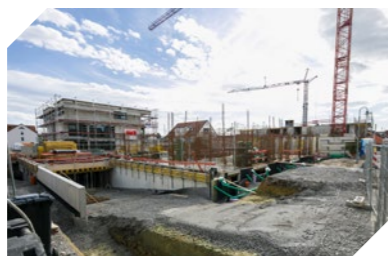
Ortskernbelegung weiter vorantreiben

Wir möchten die Belegung des ORTSKERNS entscheidend voranbringen. Daher plädieren wir für einen Abriss der Aussegnungshalle, an deren Stelle ein Gebäude errichtet werden soll, welches u.a. für die Ausrichtung von Festen und die dauerhafte Einrichtung eines Bürgercafés genutzt werden könnte. Auch die Gestaltung eines BÜRGERPARKS auf der Fläche des alten Friedhofs, über dessen genaue Gestaltung die Bürgerschaft entscheiden darf, ist für uns vorstellbar.