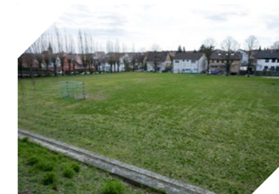
Hier soll langfristig Wohnraum entstehen

Wir stehen zu der Richtung, welche die Gemeinde in Bezug auf die Erweiterung des GEWERBEGEBIETS „GRÖNINGER WEG“ eingeschlagen hat. Die Gemeinde benötigt eine breitere Basis an Einnahmen, um die eigenen Aufgaben, wie zum Beispiel in der Kinder- und Seniorenbetreuung, weiterhin meistern zu können. Wer sich gegen die Erweiterung stellt, riskiert auf Dauer unsere Unabhängigkeit und treibt uns in eine Schuldenspirale.